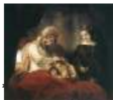
Rembrandt, Jakov blagoslivlja Josipove sinove, 1656